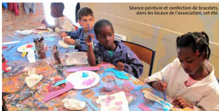
Séance peinture et confection de bracelets, dans les locaux de l'association, cet été.